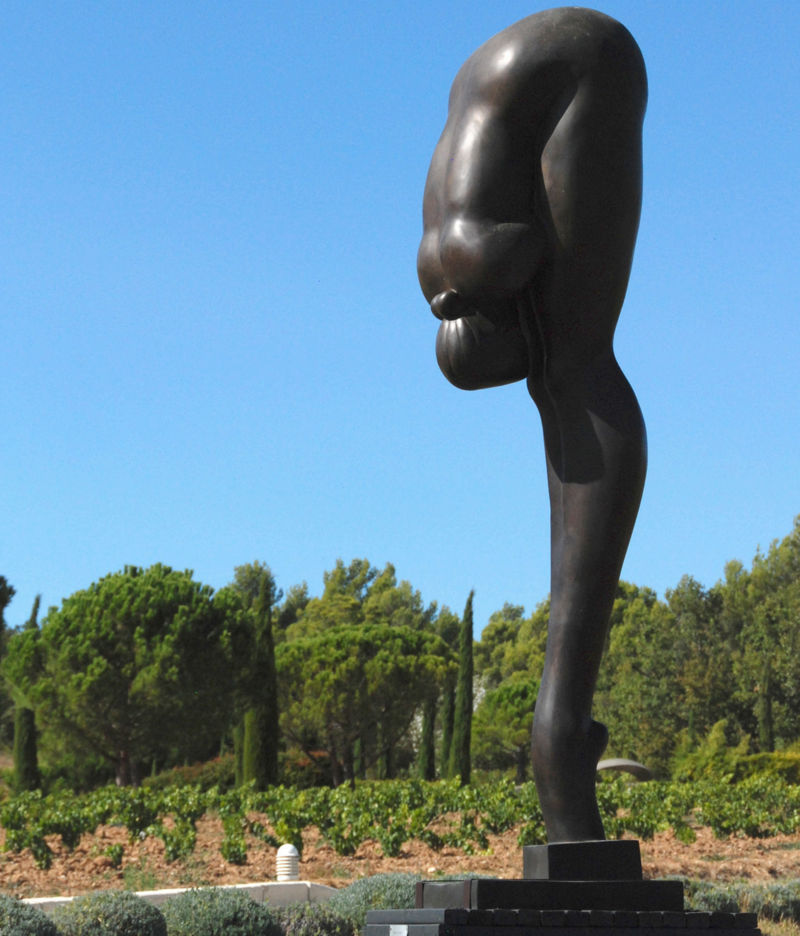
La Cueilleuse de secret, oeuvre réalisée par Philippe Chazot et exposée dans le jardin Quiqueran du Château des Baux-de-Provence