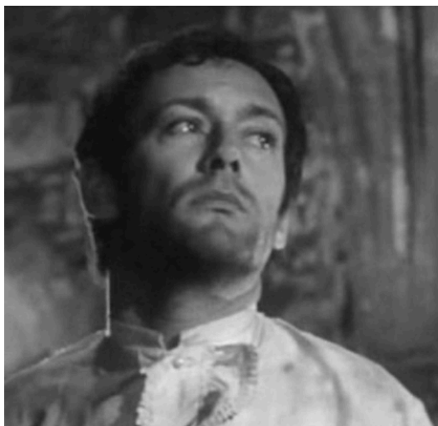
Image issue du court métrage Le Puits et le Pendule d'Alexandre Astruc réalisé en 1964