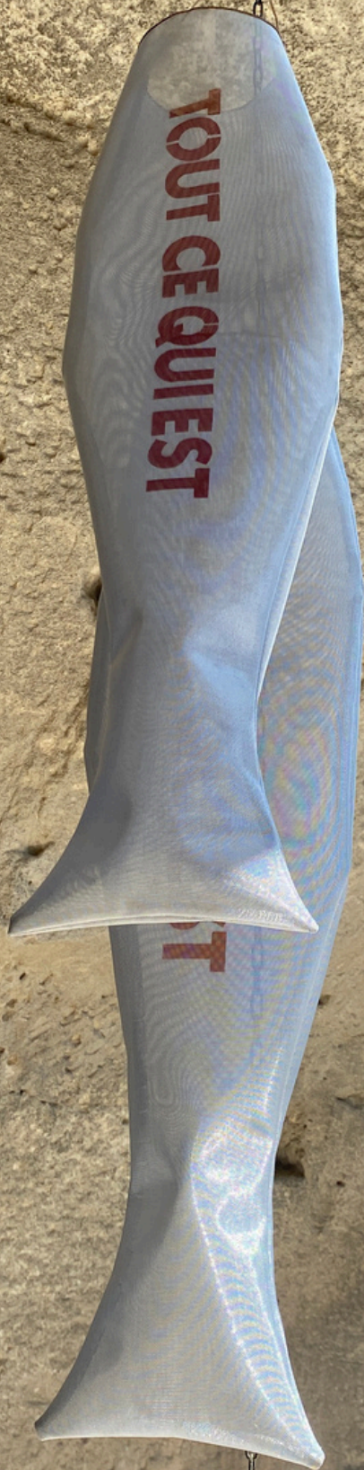
Présentation de l'œuvre de Ziyu Zhou dans les maisons troglodytiques du Château des Baux-de-Provence.