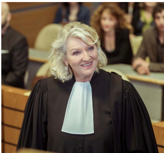
Image issue du téléfilm La Loi de Valérie de Thierry Binisti, réalisé en 2018.