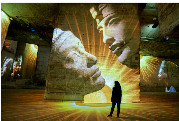
Vue de l'expérience immersive « L'Égypte des Pharaons : De Khéops à Ramsès II »