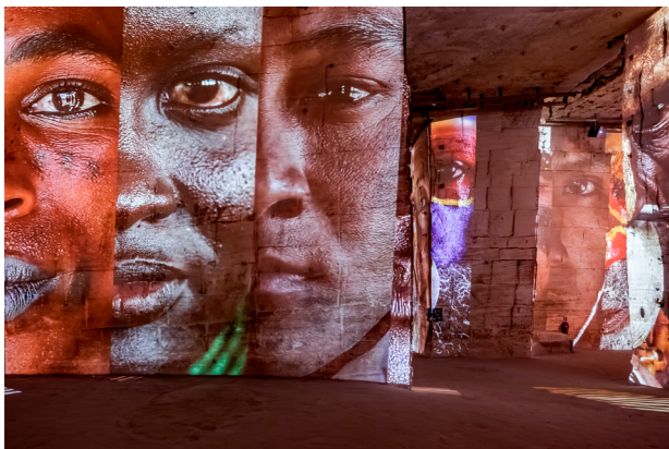
Vue de l'expérience immersive « Jimmy Nelson, Les Gardiens de l'Humanité : The Last Sentinels »