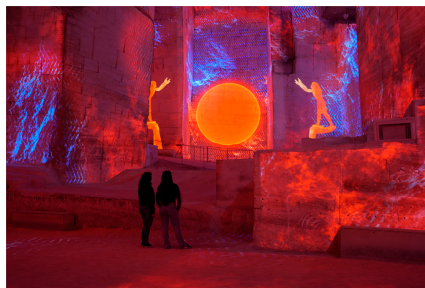
Vue de l'expérience immersive « L'Égypte des Pharaons : De Khéops à Ramsès II »