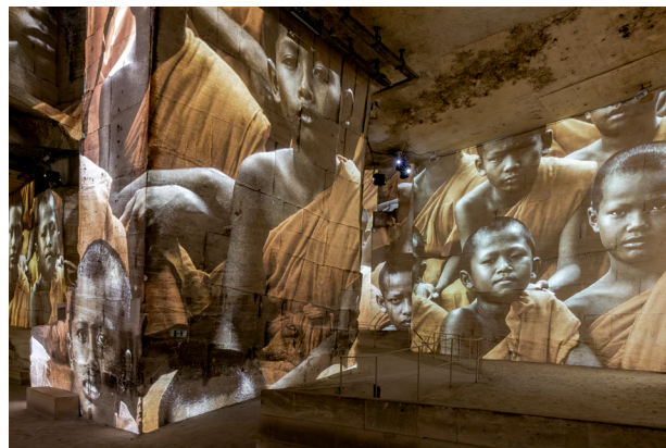
Vue de l'expérience immersive « Jimmy Nelson, Les Gardiens de l'Humanité : The Last Sentinels »