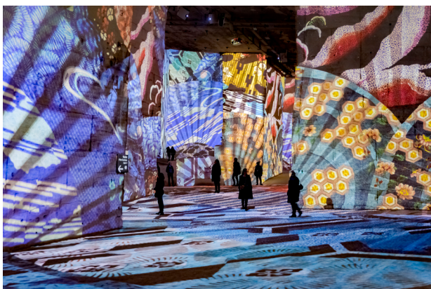
Vue de l'expérience immersive « Japon Rêvé, Images du monde flottant »