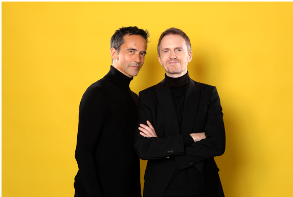
QUEYRAS THARAUD