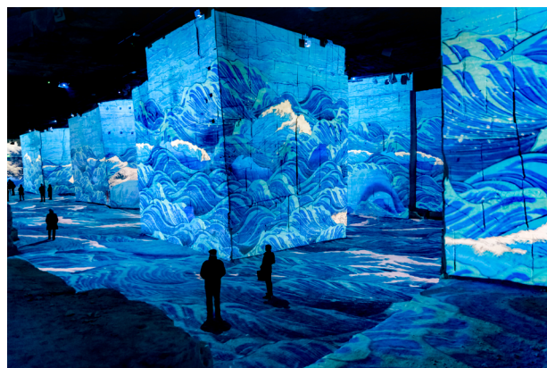
Vue de l'expérience immersive « Japon Rêvé, Images du monde flottant »