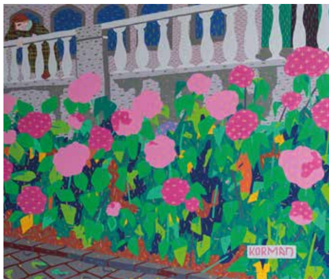
Michal Korman, Balustrade , huile sur toile