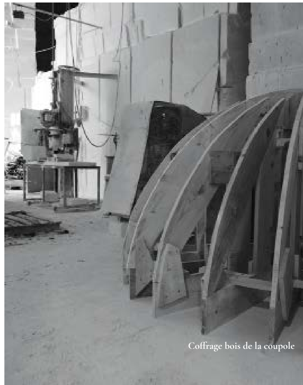
Coffrage bois de la coupole