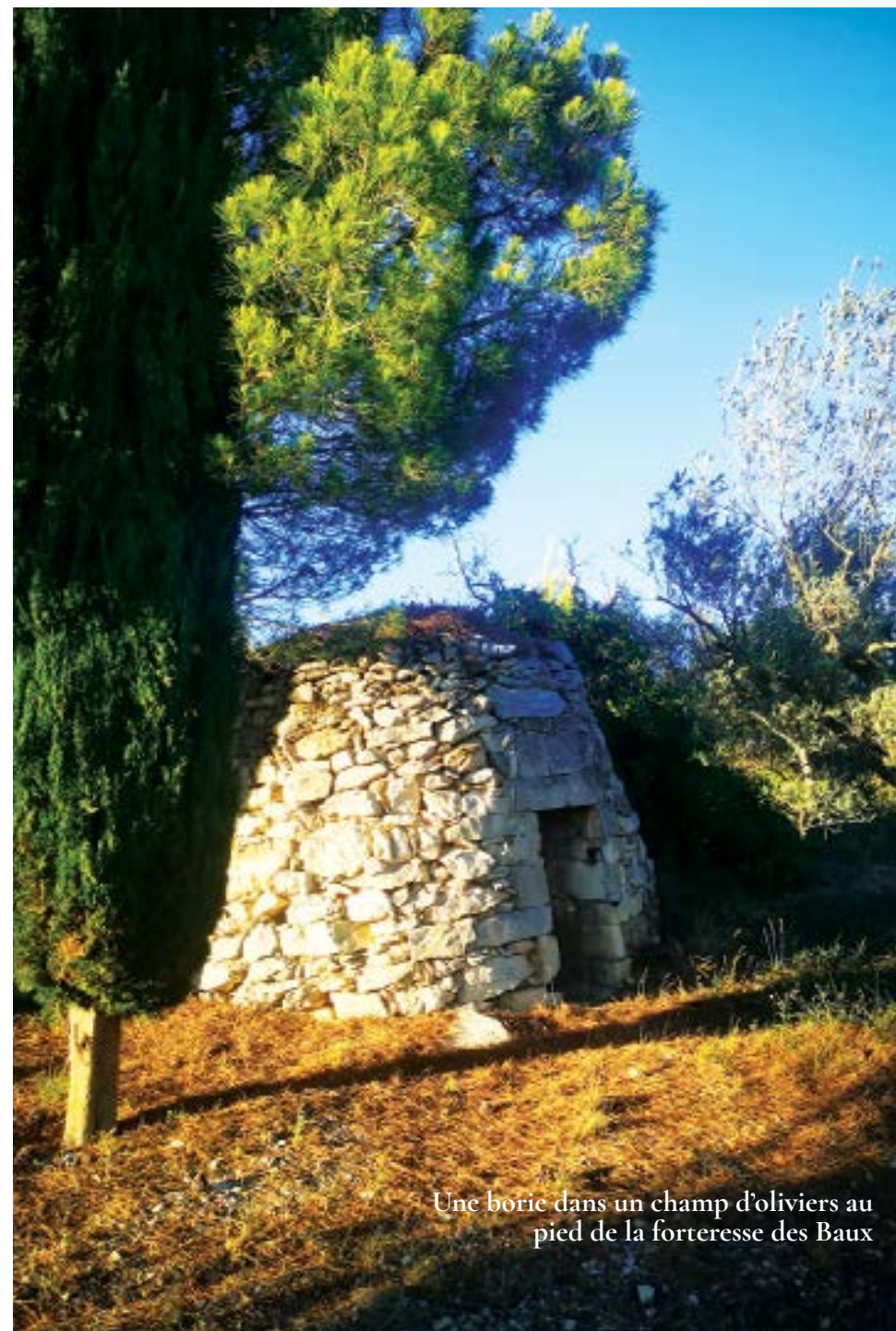
Une boric dans un champ d'oliviers au pied de la forteresse des Baux