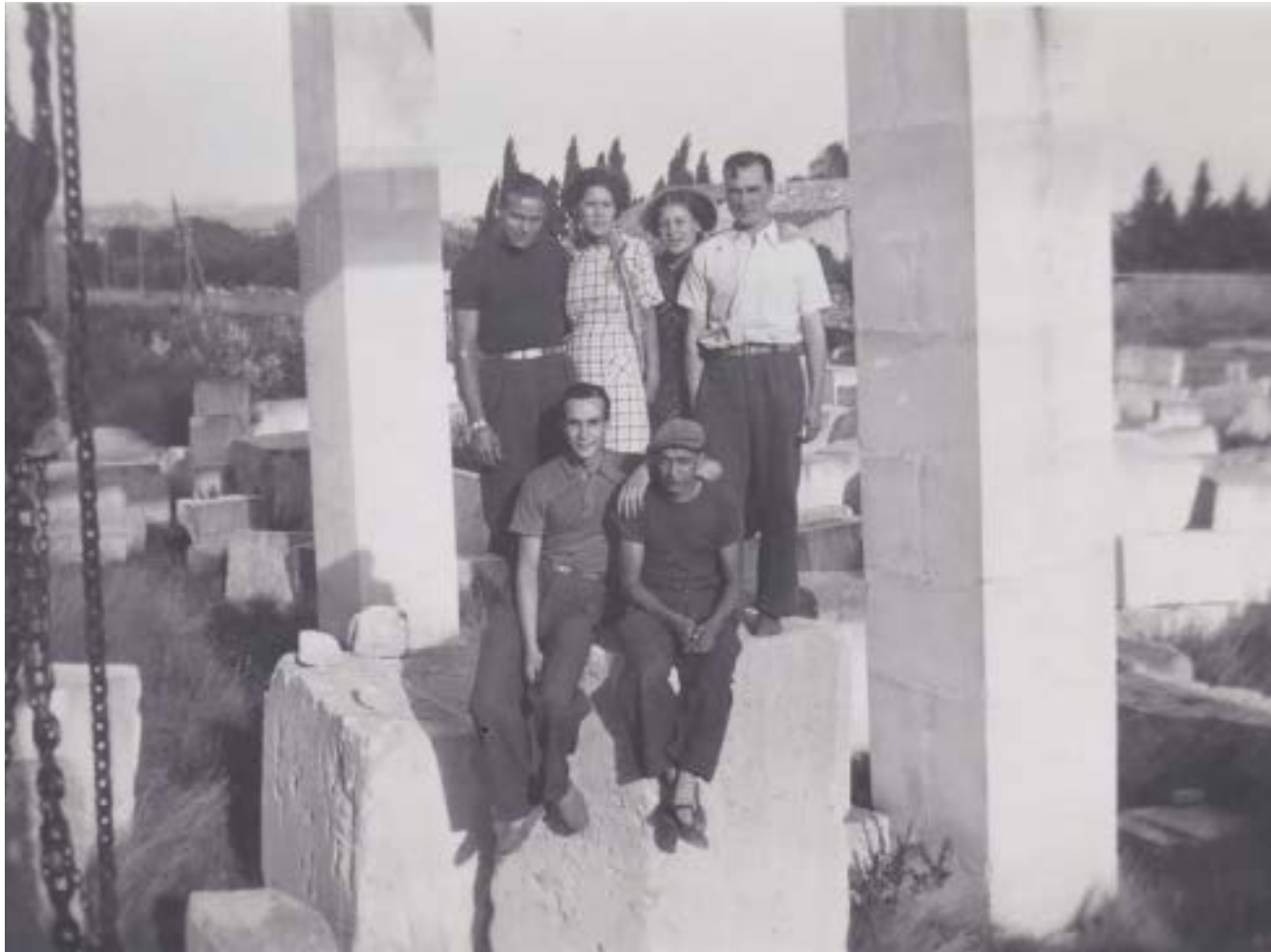
Pont roulant au Nord de la gare Les Baux - Paradou qui permettait le déchargement des blocs extraits des carrières baussenques de Sarragan et des Grands Fonds dans le Val d'Enfer.