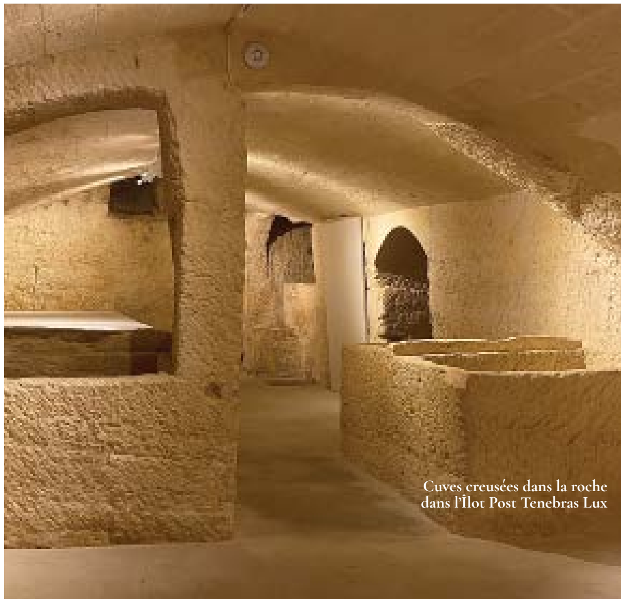
Cuves creusées dans la roche dans l'Îlot Post Tenebras Lux

Les habitants du vieux village et de ses val- lons creusent cuves et réservoirs directement dans la roche. Dans les caves des maisons on trouve des aménagements destinés à recueillir l'eau ou stocker les denrées alimentaires. Dans l'Îlot Post Tenebras Lux, l'architecture révèle quatre cuves monolithes, un arc et un pilier entièrement taillés dans la montagne.