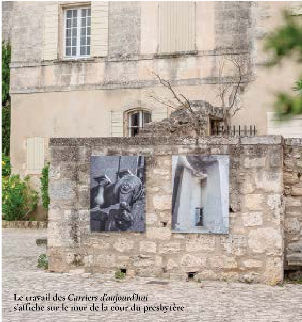
Le travail des Carriers d'aujourd'hui s'affiche sur le mur de la cour du presbytère

Depuis l'Antiquité, les carrières de pierre font battre le cœur des Baux-de-Provence